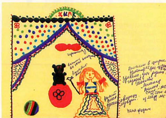
A 9-year-old girl drew a circus, explaining that children from all over the world are welcome to play there, except for children from Karabakh. In 1990, the girl and her family fled Baku for Martakert, then in 1992 they escaped to Stepanakert.