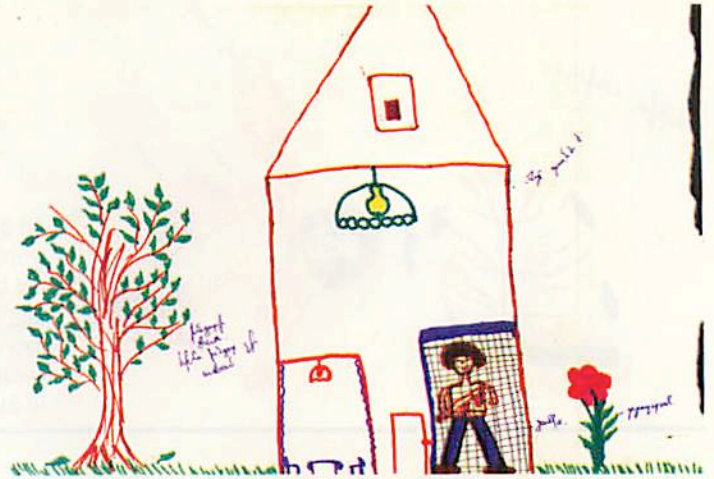
A girl shows fear of going back to her home in Martakert because there were Azerbaijani soldiers in the house when they escaped. She remembers Azerbaijani soldiers beating her father in their house in Baku. During a therapy session, the girl put the Azerbaijani soldier in "prison" as a way to deal with her fear and anxiety.