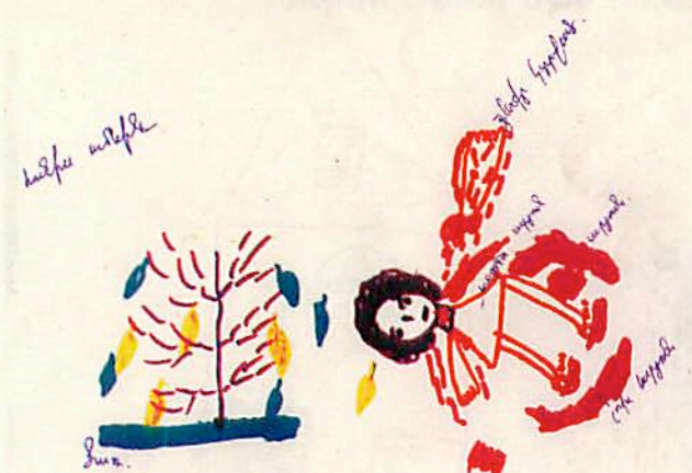
An 8-year-old girl shows a wounded soldier with arm cut off, covered with blood, that she and her family saw in the woods while escaping from Martakert to Stepanakert in 1992.