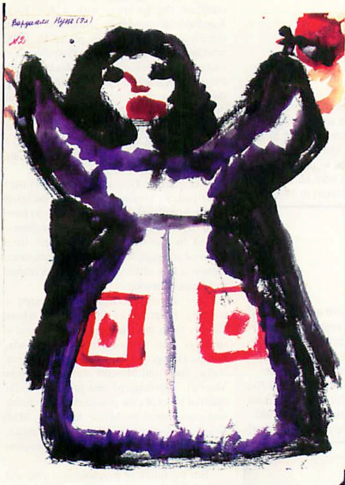
8-year-old girl projects fear through her mother's image.