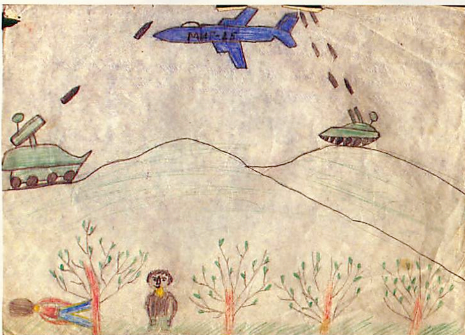
11-year-old Stepanakert boy presents a picture of the war. The tanks are unable to down the plane; anxiety is the dominant phenomenon in his perception of his surroundings.