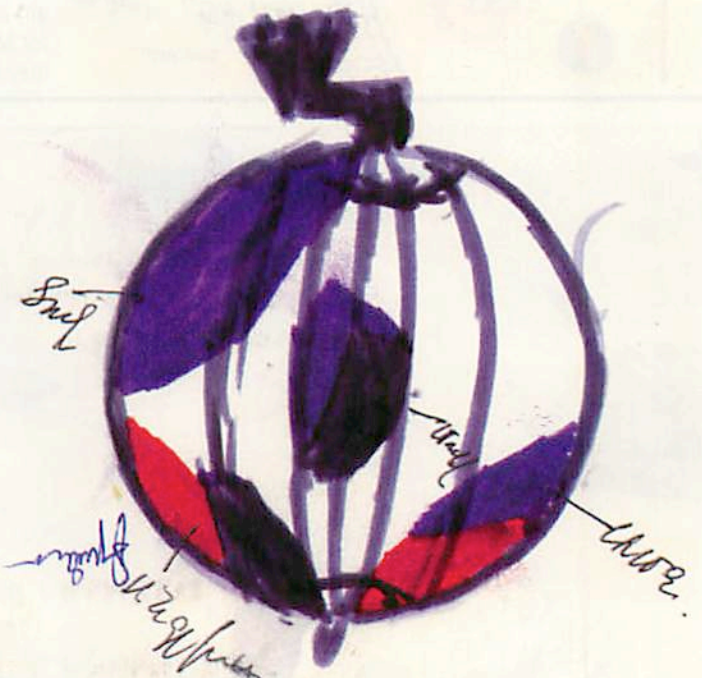
The globe drawn by an 8-year-old boy showing Moscow, France, US, England, and France. When asked where is Karabakh, he said, "Karabakh is not on the map, no one cares about Karabakh."